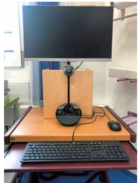
Die gewählte Technologie stellt sicher, dass während der telemedizinischen Beratung (Bild: Arbeitsplatz in der JVA Pöschwies) keine Videoverbindung abgehört, verfälscht oder von Dritten gesehen werden kann.

Auch wenn die Durchführung der telemedizinischen Beratung einfach und benutzerfreundlich ist, kommt der Weiterbildung bei der Einführung der Telemedizin eine entscheidende Bedeutung zu: Es geht darum, Vertrauen zur gewählten Lösung zu entwickeln und Handlungskompetenzen aufzubauen. Ein tragender Pfeiler ist die telemedizinische Triage: Standardisierte Prozesse zeigen auf, wie dringlich die Behandlung