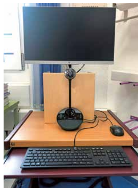
Grâce à la technologie choisie, aucune communication vidéo ne peut être écoutée, falsifiée ou vue par des tiers durant la téléconsultation (illustration : place de travail dans l'établissement pénitentiaire de Pöschwies).

Si la réalisation des téléconsultations est simple et conviviale, la formation n'en joue pas moins un rôle déterminant durant la phase initiale. Il s'agit en effet de développer la confiance envers la solution choisie, de même que les compétences nécessaires. Le triage est une pièce maîtresse du dispositif : des processus standardisés permettent de définir dans quelle mesure un traitement est urgent et si le recours à la télémédecine est possible et